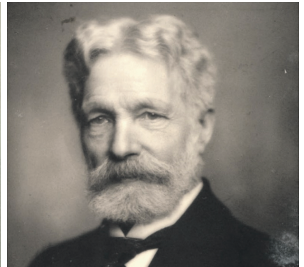
Ung og eldre Næss: To av svært få foto av Leonhard Næss.