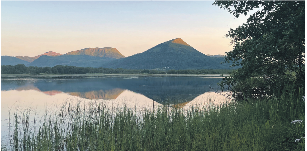
Leiv Arne Grimstad har teke dette biletet av Grimstadvatnet i Hareid på Sunnmøre.

I 2015 fekk underskrivne ei utfordring: Kunne eg skrive eit dikt om håp til den russiske folketonen «De hvite akasier»?