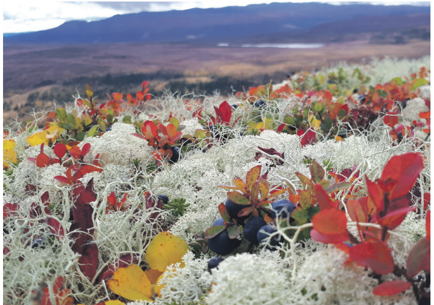
Stille nærvær: Naturen er tolmodig og kan lære oss å vente på betre dagar, skriv Leif Bremer. Fotoet er teke ved Ormtjernkampen i Gausdal i Innlandet av Marianne Bækken Christiansen.

Inni meg er det eit tankekøyr på kva eg skal gjere som kan hjelpe, men sjølv om eg leitar i alt eg har lært, finn eg ikkje noko. Berre dette, at eg kan la orda teie og legge ned mitt behov for å løyse flokane.